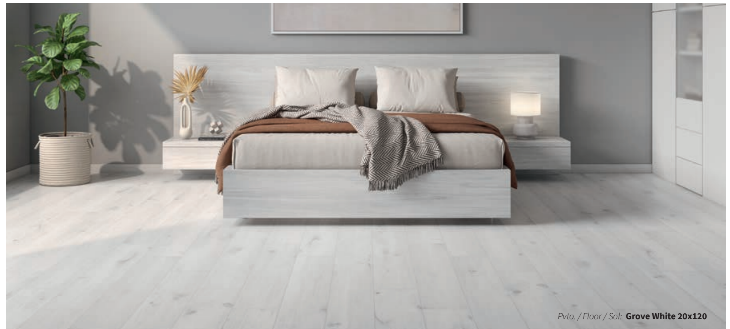
Pvto. / Floor / Sol: Grove White 20x120

Ver efectos / View effects / Voir les effets