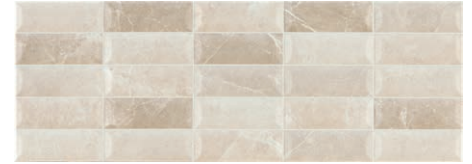
At. Rlv. Assal Crema