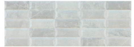
At. Rlv. Assal Gris