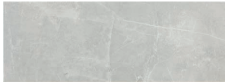
At. Assal Gris