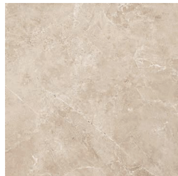
At. Assal Perla