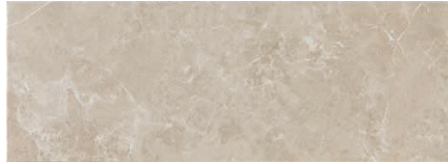
At. Assal Crema