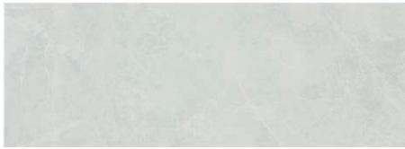
At. Assal Perla

RVTO. PASTA ROJA RED BODY WALL TILES · REVÊTEMENT PÂTE ROUGE