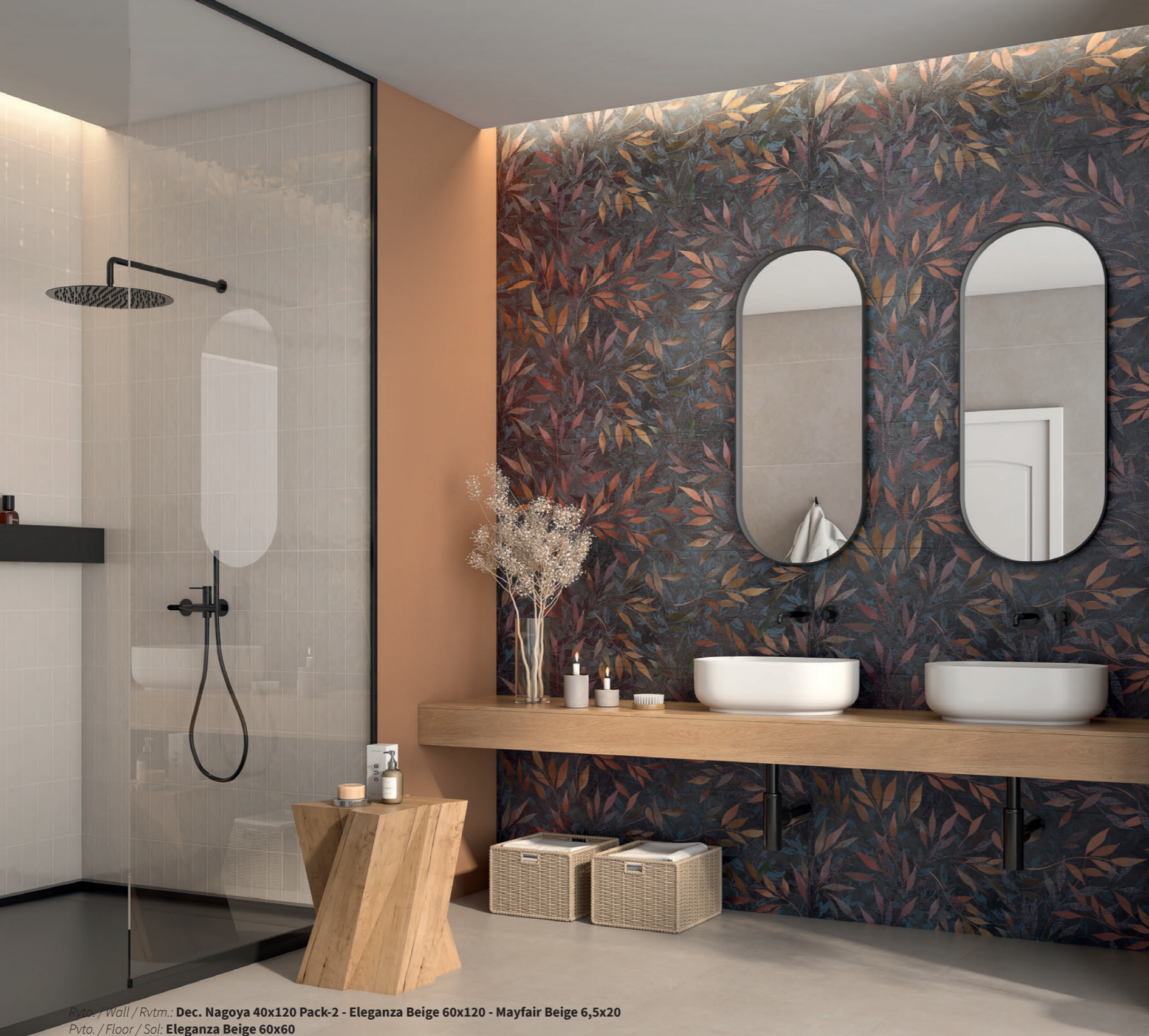
Rvto. / Wall / Rvrm.: Dec. Nagoya 40x120 Pack-2 - Eleganza Beige 60x120 - Mayfair Beige 6,5x20 Pvto. / Floor / Sol: Eleganza Beige 60x60